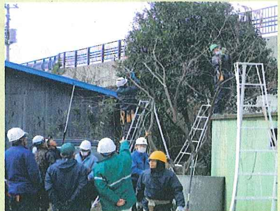
3月8日 緑樹管理講習会