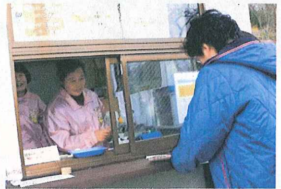
スロープカー乗車券販売